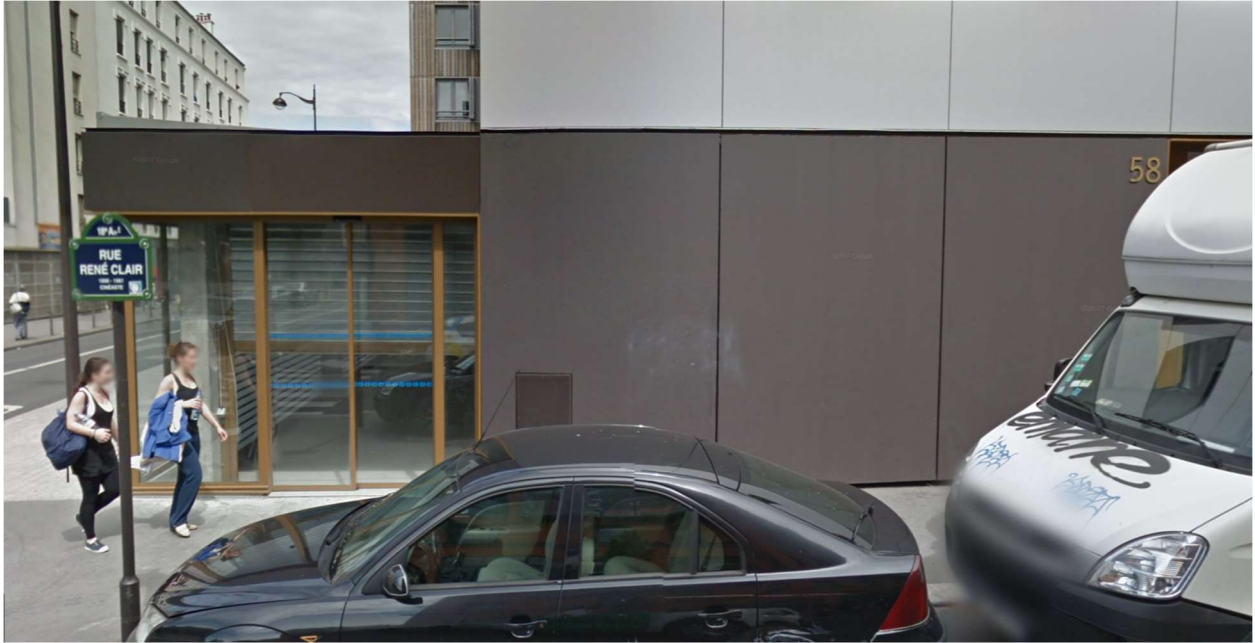
Rue René Clair, Paris