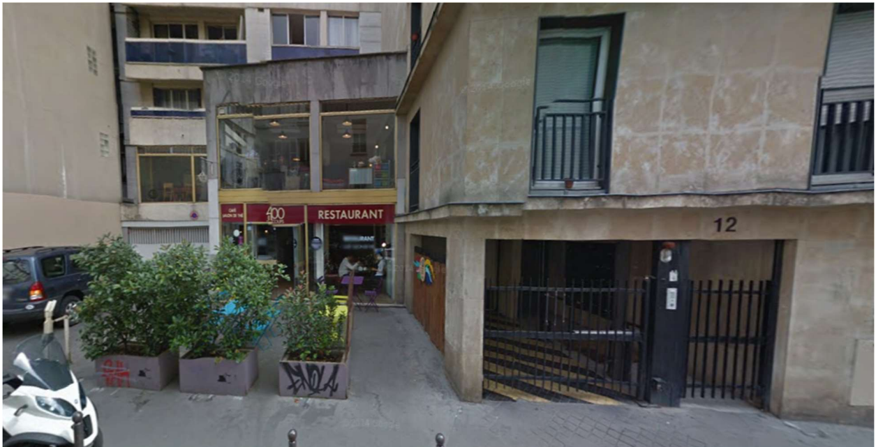
Rue de la Villette, Paris