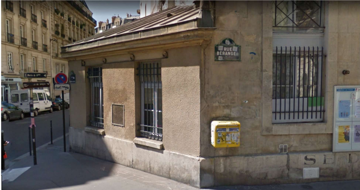
Rue Béranger, Paris